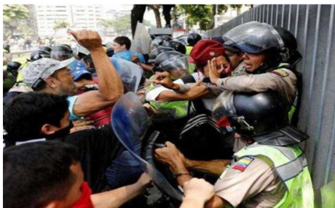
Angriff auf unbewaffnete Polizistin

Es gibt einerseits friedliche Demos – sowohl gegen wie auch für Maduro – aber auch das: 5 Polizisten sind durch Schusswaffen ums Leben gekommen, immer wieder werden "Molotowcocktails" eingesetzt, d.h. Benzinflaschen mit brennender Lunte, die schwere bis tödliche Verbrennungen verursachen können. Darauf würde auch in Deutschland hart reagiert werden.